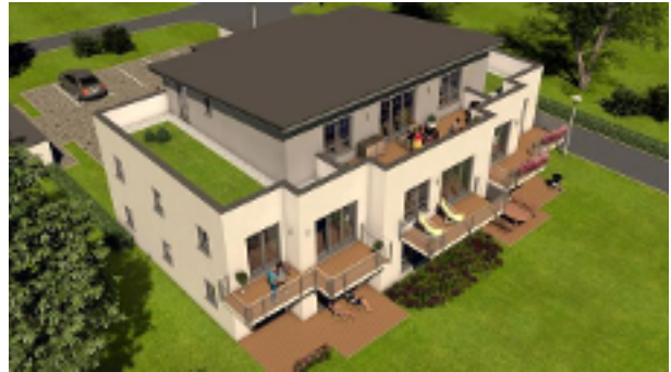
Grosszügige Balkone und Terrassen