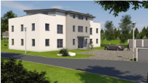
Vorderansicht mit Stellplätzen